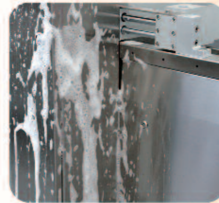
IP 67 PROTECTION